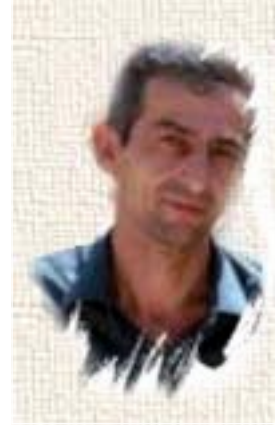
◆ عبدالكريم الكيلاني