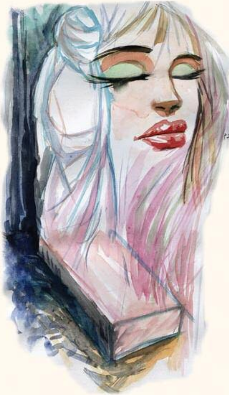
غاندىي كۆلە وار

دونيایەکا وەكى دەریایەکا سیرە.... میرە.... و سەرکیشى میرایە ناگر و مژیرە و خەونین ژار د تەرا زوا خودى دادچنە دۆزەھى ل بن شاپەریت رۆزى نقىزا دكەن كەنگى دى مرم.. مریەكى سەرەمردم تەدقیت دم بئاختم... تەدقیا هەوارا د مەیدانا خودى سەرى دا قەدەم ئەو وارى تە زى شەرم لى من زى گەرم و نەبوونى ئىك ماچ كەین؟ ئەزخەزین دلدارا گەرم كەین گورى مە ب هە شاد كەین گەر دەستى تە كفنى بۇ من ل دەرزى نەدەت مویین لەشى من وەكو شاها ل تینوسى مار نەكەت.. ئەقجا هەرە سنگى تە تینوسا فیرەونتا پت ئەو پەيقا تیدا بکەتە شاھ و سەرکیش و میر وشلۇقە كەتن ژنرسا قەدخوار و گوھین راستىي بەل دمان و هەیف خودا دكر مانین بى گومان دكرتە نەمان ل ناف گۆرستانا دلى مە دكرتە شېخ و مەلا و قەشە بەكرۆك و قەقرا و كۆچەك و ئافا هیوانى و سىاسەتا خودى پەرىسا ئەم ژسەر هەق رادكرین.. هەیفى خودە دتخافت