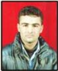
بنوار ندریس نه مین

ژبلی ته نادهن چ بلبلی مزگینیا بوهاری نا راجینن هیلینا قیننی، سرتاکیت دارا ژبیری کوترکین قاصد پورو بال شکستی نه په پیام نینه ژ دوریا ته پهریشان و وهستی نه خوارین خه مه، درمان مرن ... خه بهر نینه ببه پاشا، تاج و نهختا ژ همویا بستینه ل باژیری هیمنی دا تویی سلگان ... که سهک نینه هر تویی ... بی ته نه قیندار بی مهیو هستی نه