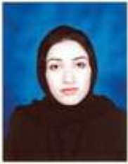
هوزان سه باح خانو

ژبلی ته نادهن چ بلبلی مزگینیا بوهاری نا راجینن هیلینا قیننی، سرتاکیت دارا ژبیری کوترکین قاصد پورو بال شکستی نه په پیام نینه ژ دوریا ته پهریشان و وهستی نه خوارین خه مه، درمان مرن ... خه بهر نینه ببه پاشا، تاج و نهختا ژ همویا بستینه ل باژیری هیمنی دا تویی سلگان ... که سهک نینه هر تویی ... بی ته نه قیندار بی مهیو هستی نه