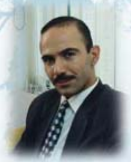
ئا. د. پەرچان ھاشم ناكرەبى چارەسەركارى دەرۋىسى ل بىنگەھىن دەرۋىسى PSETC