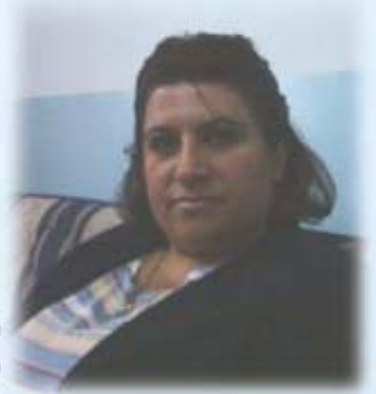
سومہیا سعید ریقہ مہرا بنگہہن بہرہمفکر و رہوشہ نمبر کرنا نافرہتی / دھوک

د درنیزیا میرووی دا گہلہک توند و تیزی دژی نافرہتی د ہمی جفاکاندا ہاتیہ کرن.. بیگومان جفاکی مہ زی بی بہر نہبویہ ز فی توند و تیزی، زبہر گرنکیا فی بابہتی مہ نہف بادہک فہکریہ.