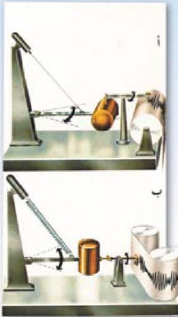
نامیږی پټوانی پلهی بومه له رزه

پیش چند مانگیک بومه له رزه په کی گه ووه و به هیڅ له ټوقیانووسی هندي دا روویدا، هیڅی ټم بومه له رزه په پټوهری ریخته ر (۹/۸) پله بوو، له ټه نجامدا ټاوی ده ریا به به رزی (۳۰) مه تر به هیڅی مه زن و بی وینه ووه ووه ک لا فوویکی بی هاوتنا که ناره کانی ده ریای گرت ووهو زیانیکی زوری به ټاوه دانی و ټهو مروقه انه ی له نزیک که ناری ټوقیانووسی ووه بوون گه یاندو زیاد له ۲۵۰۰۰۰ هه زار مروقه بوون به قوربانی و زیانی مادیش به زیاتر له (۵۰) په نجا ملیار دولار ده خه مینریت.