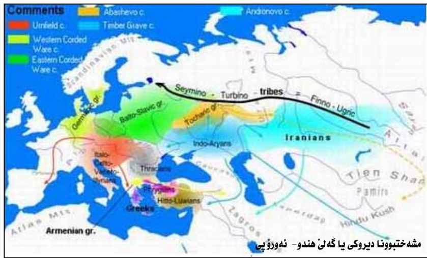
مشە ختبوونا دیروکی یا گەلی ھندو - ئەورۆپی

ئەف ھەر دوو زمانە مینا کەرەستە و ژئیدەرین بەرئ ددەنە خویا کرن ژ چەند قۆناغان دەریاز بووینە و بقی رەنگی نھو گەھشتینە مە ئەو قۆناغ ژئ (ئاقیستا و پەھلەوی) نە.