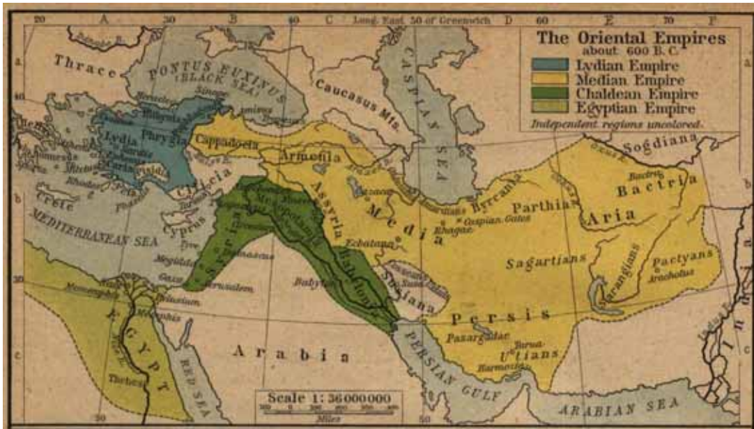
به لاقبوونا گه ئی هندو- ناری

پیتشقه چوونا زمانی و اتا په یقی ژ پشکه کا ناخافتنی بو پشکه کا دی دهیتسه فه گوهاستن ب تاییه تی د پشکین (نا، هه فالنا، و هه فالکار) یدا ئەف دیارده دهیتسه دیتن لی مەرج نینه د هەمی پشکه کی دا ئەف دیارده یه هه بیت، بو نمونه جهناف ژ فی دیاردی د دورن و اتا وان بو پشکه کا دی ناهیتسه فه گوهاستن.