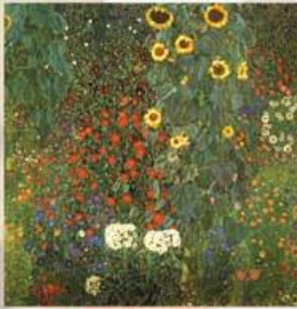
▲ ۱۹۰۵ شهرینما گونبه روژان