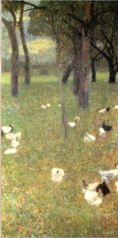
▲ ۱۸۹۹ پشتی باریتن