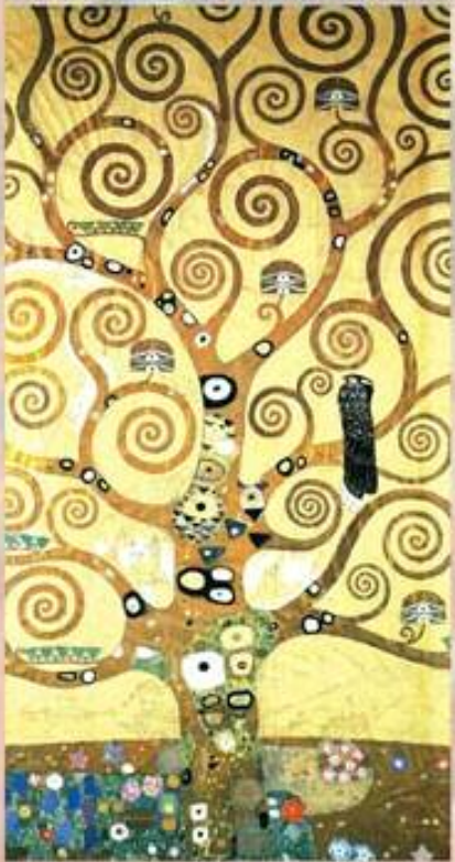
▲ ۱۹۰۵ سه نته ری پشکان د دارا ژیان دا