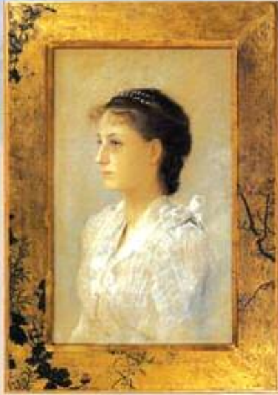
▲ ۱۸۹۱ نیمیلسی شوگن