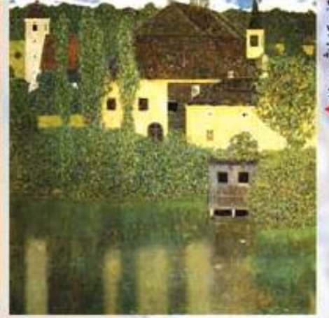
▲ ۱۹۰۸ کزچکا نالی