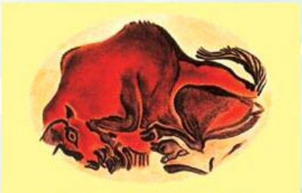
نەھ رەسمى ھوون دىبىن بەرى نىزىكى (۲۰) ھزار سالان ل سەر دىۋارى شىكەھتەكى ھاتىبە كىشان