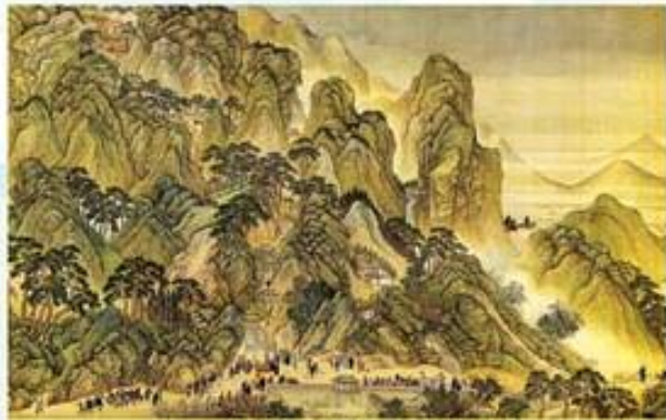
دېمەنەكى سروفى ب شىۋازى چىنى. چىنىيان شىۋازەكى تايبەت د رەسمرنا سروفى دا ھەپە كو، نە وەكى شىۋازى نەورىپانە.

بەرى ب ھزاران سالان، مروفان ل سەر دىۋارن شىكەھتان رەسمى گا، ھەسپ و خەزالان چىكرىنە. كەس ب دروستى نزانىت كا وان مروفان ب چ مەبەست نەو نىگار كىشايىنە. ۋ ھىنگى وەرە مروفان بەردەوام نىگار كىشايىنە. ھندەك ب مەبەستا تۆماركرنا روودانىن مەزن. ھندەك ۋ بۇ بەرزراگرتنا قارەمان و