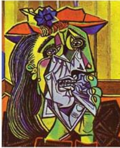
ژنک دگریت ۱۹۲۷