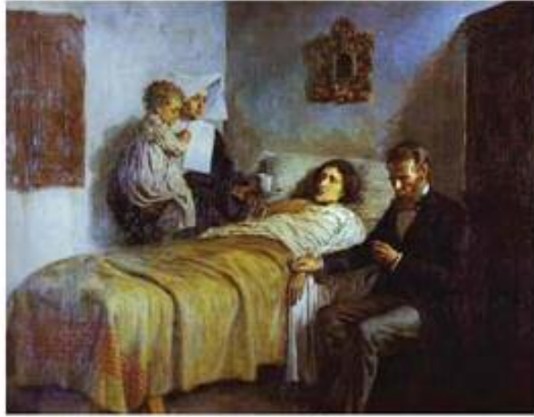
خیر و زانست ۱۸۹۷