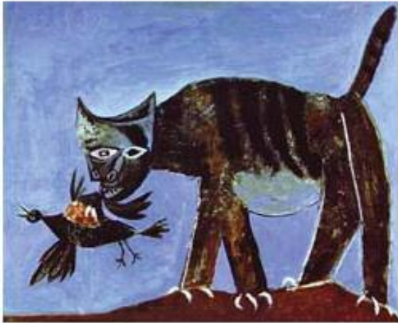
بالدھین بریندار وکیٹک ۱۹۳۸